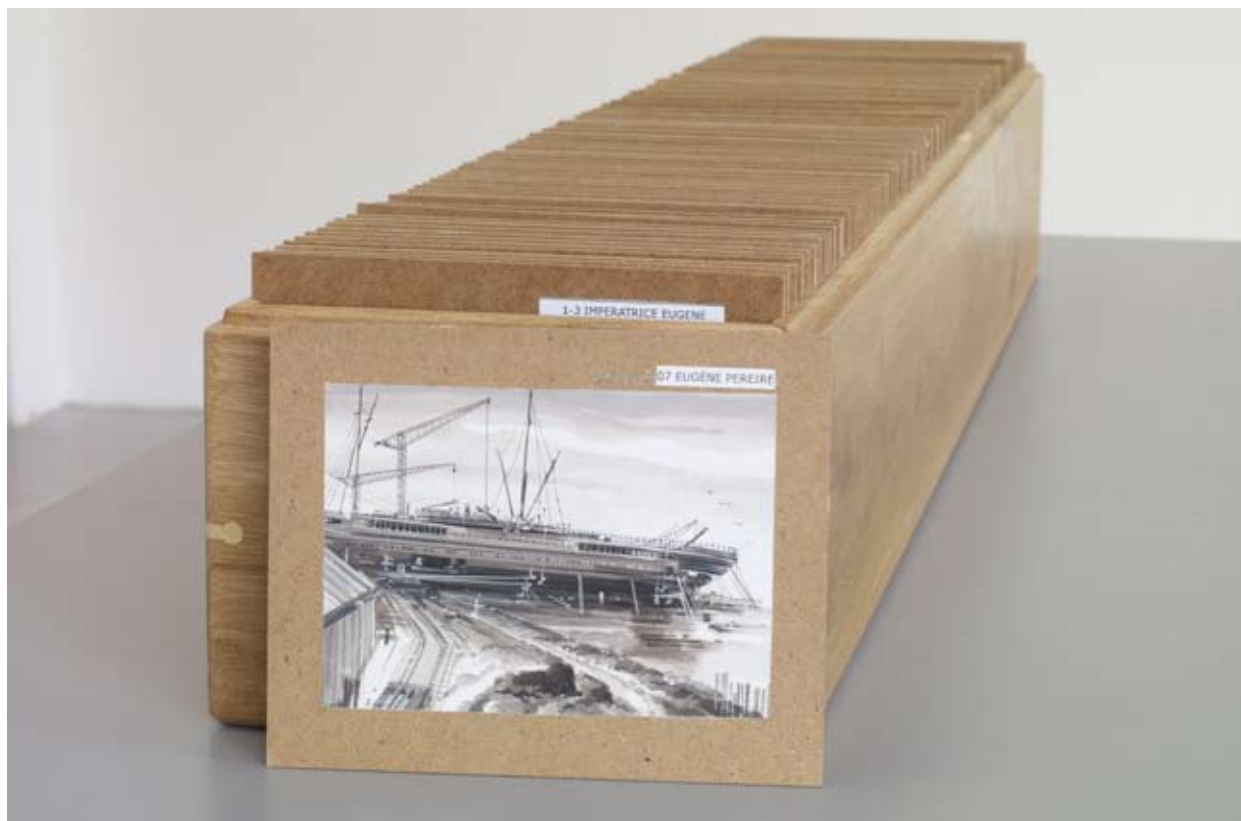
Jorge Satorre, La Part maudite illustrée (La Parte maldita ilustrada) , 2010. Installation : quatre-vingt-dix peintures sur bois (20 x 24,8 cm), boîte en bois (25 x 158 x 28 cm), trente-trois plaques offset. Production : Le Grand Café, Saint-Nazaire. Collection de Bruin-Heijn. © Marc Damage, vues de l'exposition The Indirect Gaze (l'Observation Indirecte) , Le Grand-Café, Saint-Nazaire, 2010.