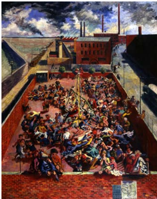
Boris Taslitzky, Le jeudi des enfants d'Ivry , 1937. Huile sur toile, 160 x 130 cm. Collection Archives municipales d'Ivry-sur-Seine. © Adagp, Paris 2012.

Visuels disponibles, téléchargeables sur www.credac.fr