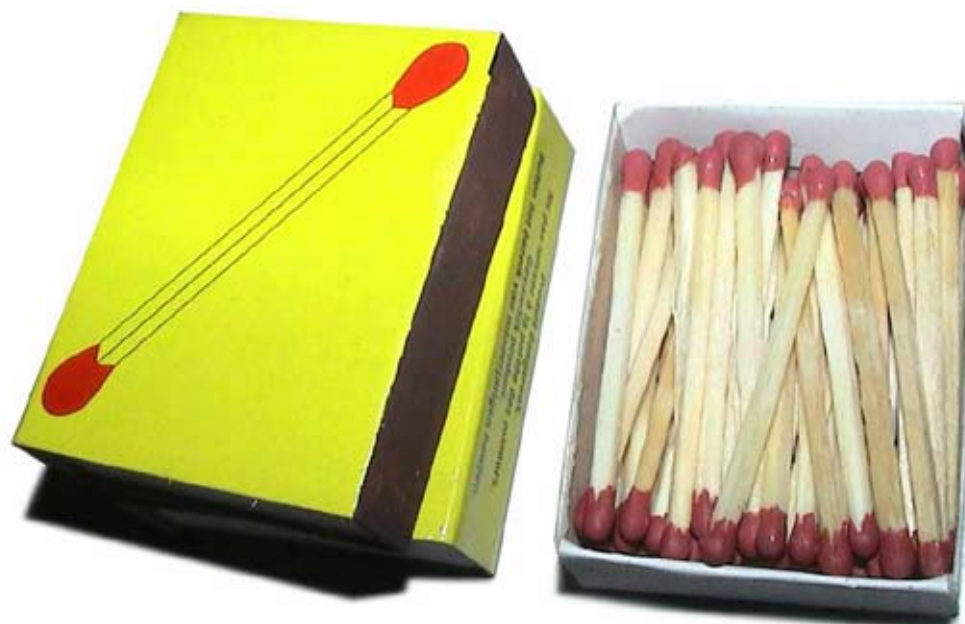
Mircea Cantor, Double heads matches , 2002. Installation : vidéo (couleur, son, 17'20), boîte d'allumettes, poster. © Mircea Cantor / Galerie Yvon Lambert. Courtesy de l'artiste et Galerie Yvon Lambert, Paris.

Visuels disponibles, téléchargeables sur www.credac.fr