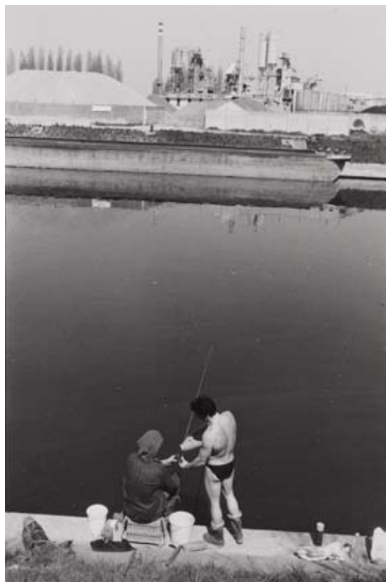
Jacques Faujour, Bords de Marne à Bonneuil , 1984. Photographie argentique noir et blanc, 40 x 30 cm.