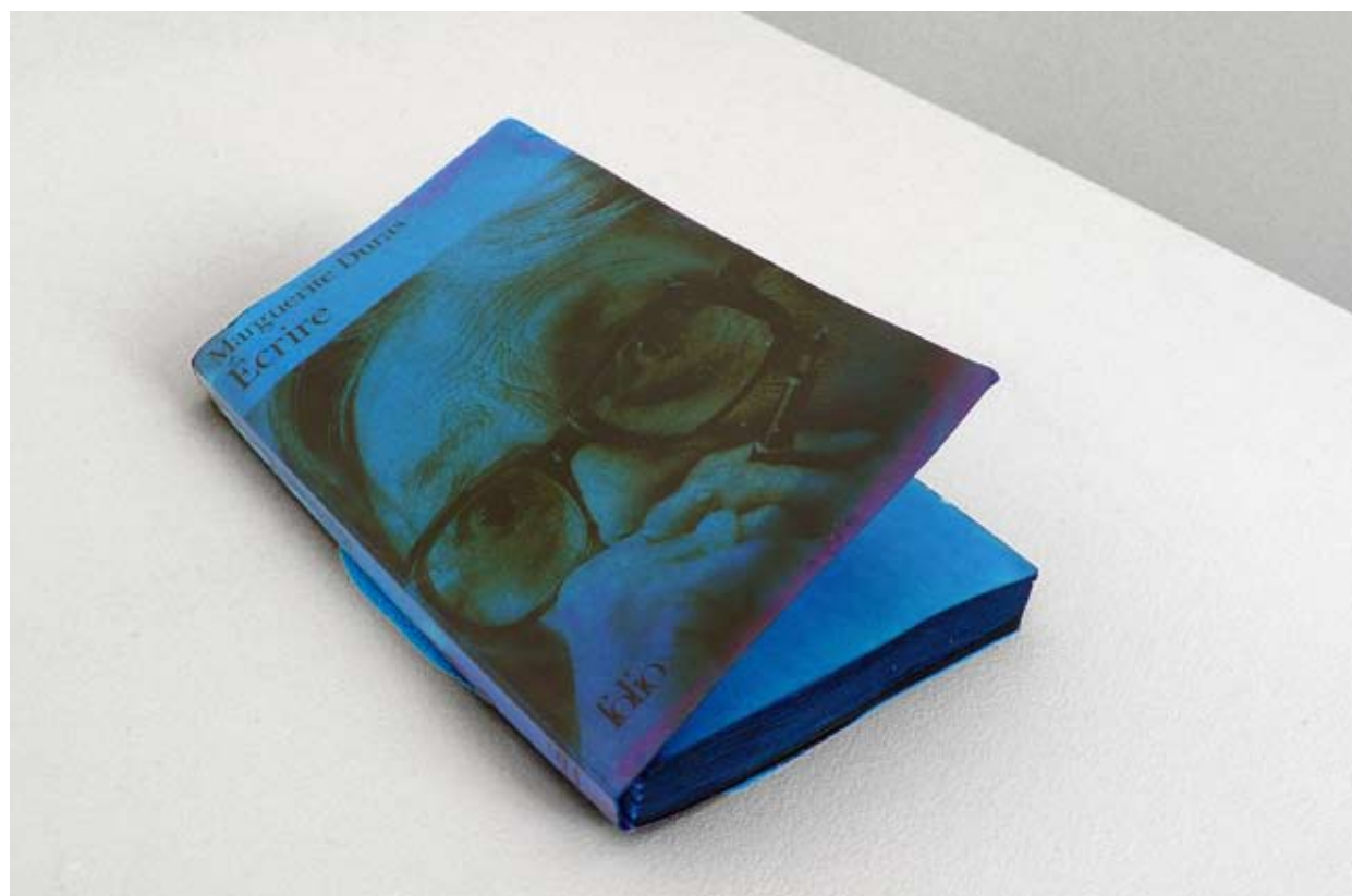
Thu Van Tran, Écrire Duras , 2009. Livre, bleu de méthylène, 10,5 x 18 x 1 cm. © Thu Van Tran.