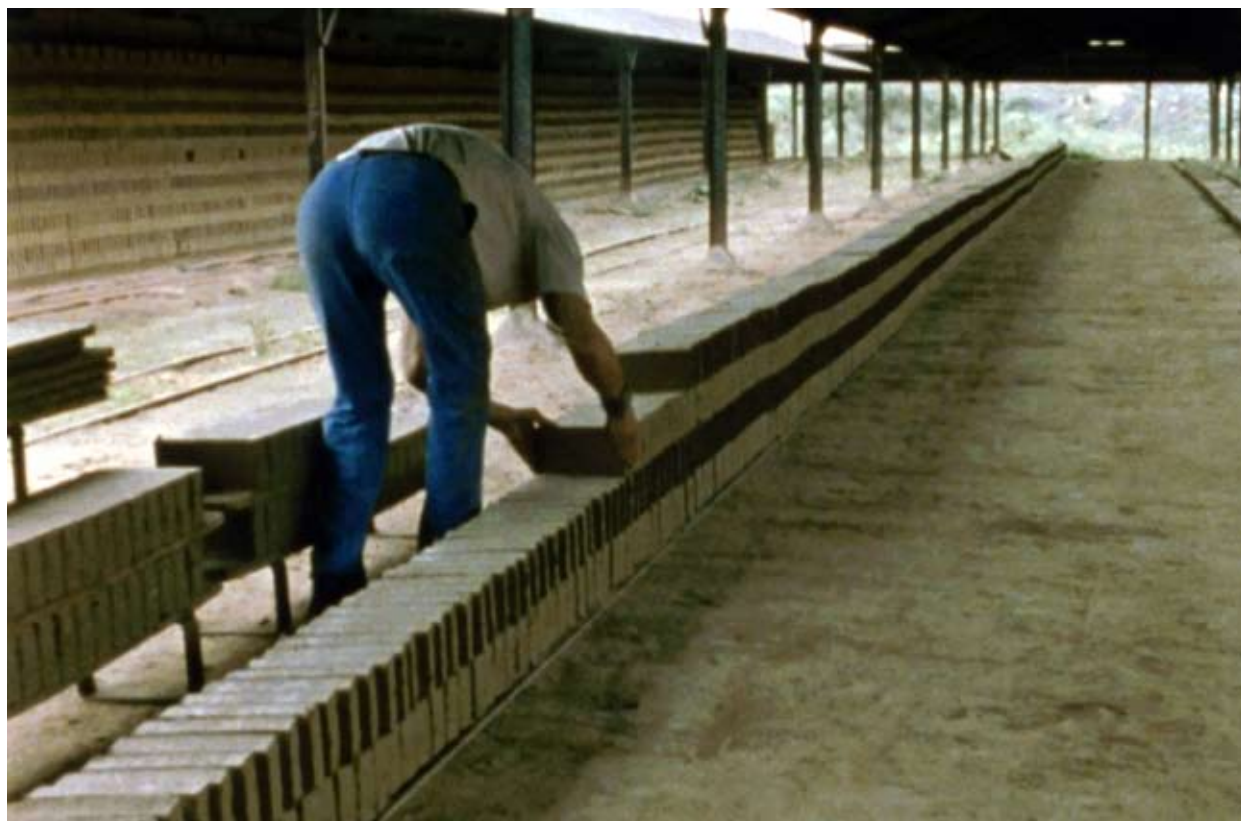
Harun Farocki, Vergleich über ein Drittes (Comparison via a Third) , 2007. Film 16 mm transféré sur Betacam numérique en double-projection, 24', couleur, son. © Harun Farocki, 2007.

Visuels disponibles, téléchargeables sur www.credac.fr